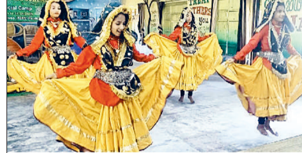
भूना। अपनी नृत्य कला का उत्कृष्ट प्रदर्शन करती छात्राएं।