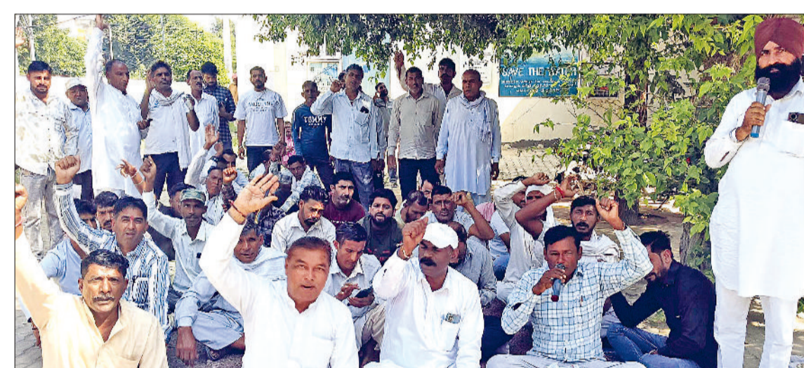
फतेहाबाद। जनस्वास्थ्य विभाग प्रांगण में धरना देते कर्मचारी।