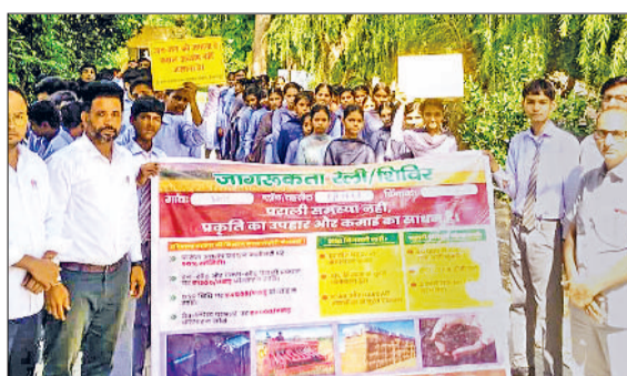
सिरसा। पराली न जलाने का संदेश देते विद्यार्थी।